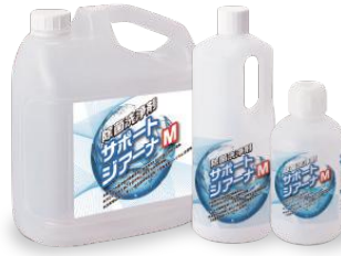
サポートジアーナM